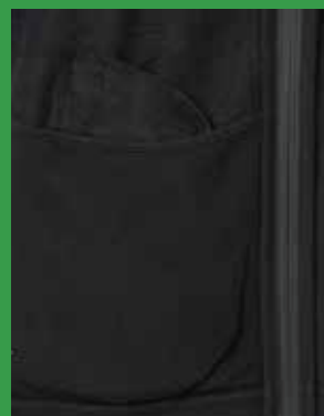
Innerficka på vänster sida.