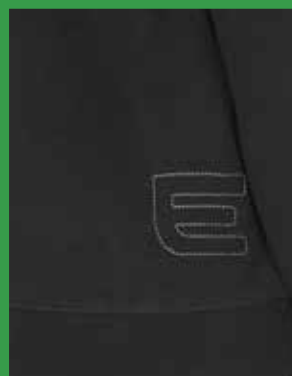
Diskret brodyr Exelar "E" hertill på bakstyckets högra sida.